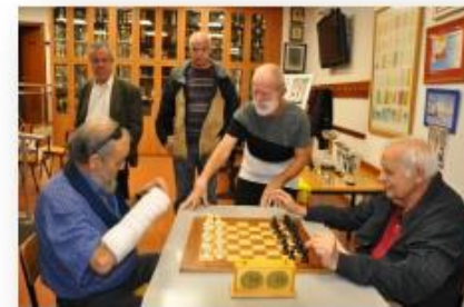
Es Disputen les fases Finals