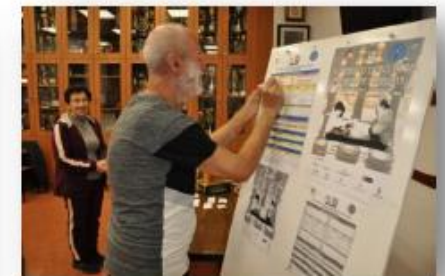
El Delegat d' Escacs de la FESC prepara tots els detalls per l'inici de la competició