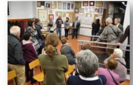
S'Entreguen els premis als Guanyadors de la Competició